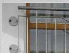
Ballustraldek / Balkonhekken