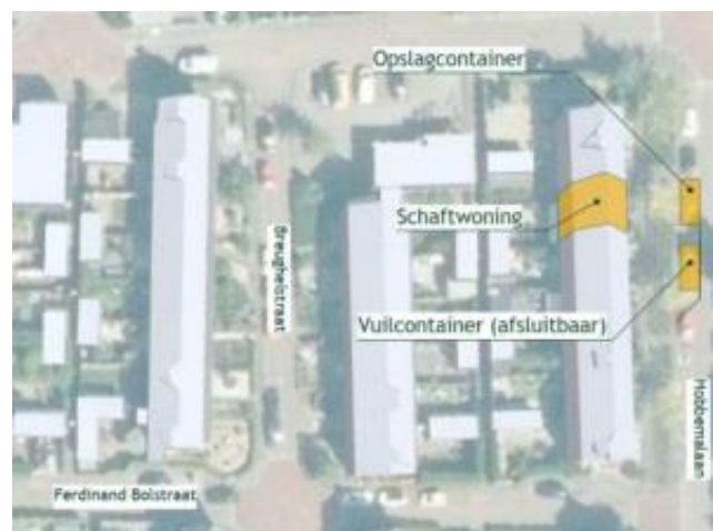
Renovatie: Ligging van schaftwoning en bouwplaats

In juli worden al enkele dingen op de bouwplaats voorbereid. In september starten we met de renovatie aan Albert Cuypstraat 2, 4 en 16 en Breughelstraat 2 t/m 16. In oktober starten we aan Breughelstraat 20, Lansing 25, 27 en 31 en Hobbemalaan 38 en 44. Mocht u hier vragen over hebben of er overlast door ervaren, neemt u dan contact met ons op.